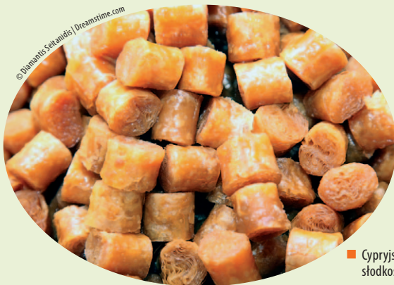
■ Cypryjskie słodkości